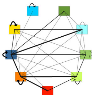
Figura 1: Mobilitat residencial entre clústers socioresidencials a la Regió Metropolitana de Barcelona.

terme a partir de les dades del Cens de Població i Habitatge de 2001, amb un anàlisi de la informació a escala municipal excepte per al municipi de Barcelona, amb el qual s'ha treballat amb informació a escala de districte. A través de tractament estadístic i finalment amb un anàlisi de conglomerats establim 9 categories o clúster amb els que categoritzar socioresidencialment el territori d'anàlisi.